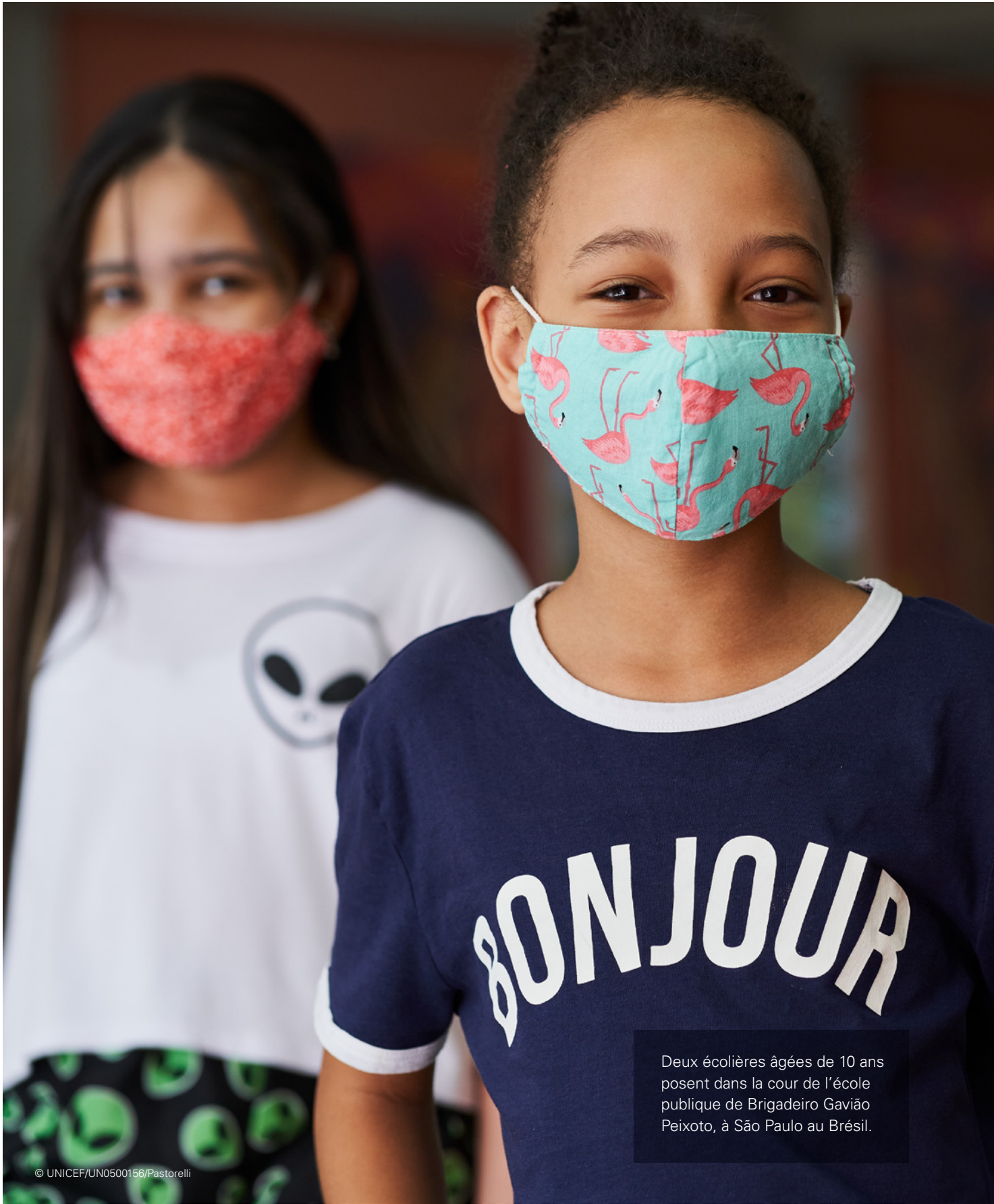
Deux écolières âgées de 10 ans posent dans la cour de l'école publique de Brigadeiro Gavião Peixoto, à São Paulo au Brésil.